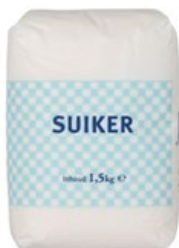
Suiker Sundale, pak 1,5 kilo, Art. nr. 95036500