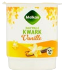
Halfvolle vanille kwark Melkan, pot 450 gram, Art. nr. 95931846