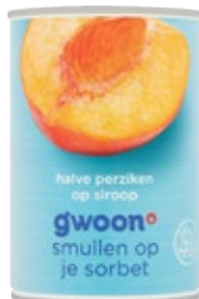
Halve perziken op siroop G'woon, blik 820 gram, Art. nr. 95644504