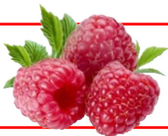
Frambozen TotaalVERS, bak 125 gram, Art. nr. 20001511